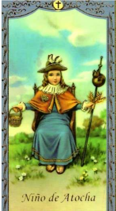
Niño Dios de Atocha